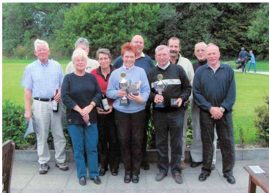
Vinderne i afslutningsmatchen og årets klubmstre

Dejlig frokost i det flotte klubhus og herunder pokal- og præmieoverrækkelse. En god afslutning på en fin sæson. Generalforsamling afholdes i februar 2005 under en træningssamling i hallen på Søværnets Sergent- og Reserveofficersskole (SRS).