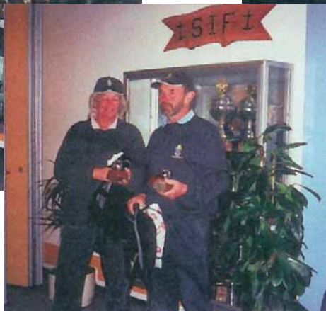
Billeder af vinderne

Vi afholder vores store Tordenskjold-turnering lørdag d.23/10 med efterfølgende afslutningsfest om aftenen.